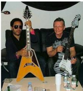
With Lenny Kravitz in stage wardrobe and one of 4 worldwide Dommenget Flying V's and a Mastercaster Zebra after the show